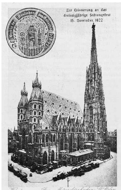
Erinnerungspostkarte der Gottscheer Landsmannschaft in Wien 1922

Aufrichtige Teilnahme, ja tiefe Trauer erweckte es, als sich die Kunde von seinem Hinscheiden am 13. Oktober 1939 verbreitete.