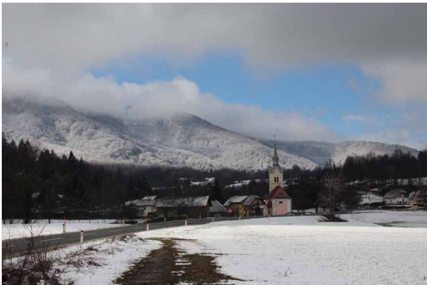
Winteridylle von Wretzen 2016, im Hintergrund der Hornwald

Man nehme 12 Monate, putze sie ganz sauber von Bitterkeit, Geiz, Pedanterie und Angst und zerlege jeden Monat in 30 oder 31 Teile, sodass der Vorrat genau für ein Jahr reicht. Es wird jeder Tag einzeln angerichtet aus 1 Teil Arbeit und 2 Teilen Frohsinn und Humor. Man füge 3 gehäufte Esslöffel Optimismus hinzu, 1 Teelöffel Toleranz, 1 Körnchen Ironie und 1 Prise Takt. Dann wird die Masse sehr reichlich mit Liebe übergossen. Das fertige Gericht schmücke man mit Sträußchen kleiner Aufmerksamkeiten und serviere es täglich mit Heiterkeit.