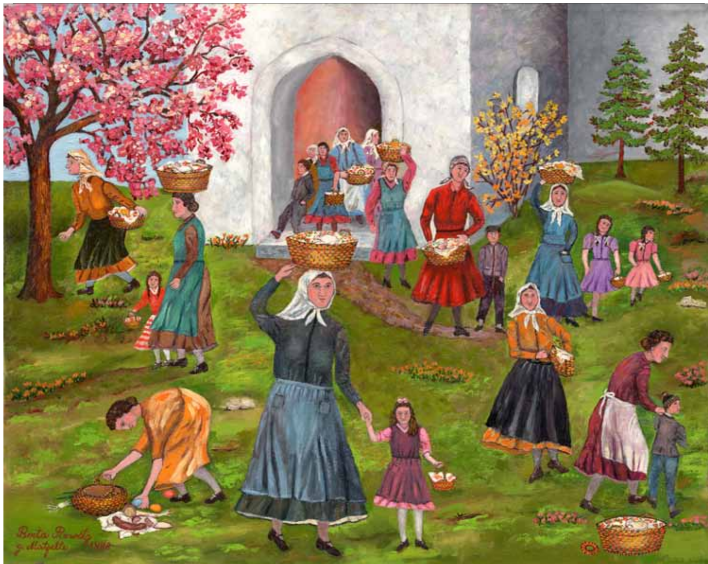
Ostern, Berta Pirwitz 1988, im Museum der Gottscheer Gedenkstätte