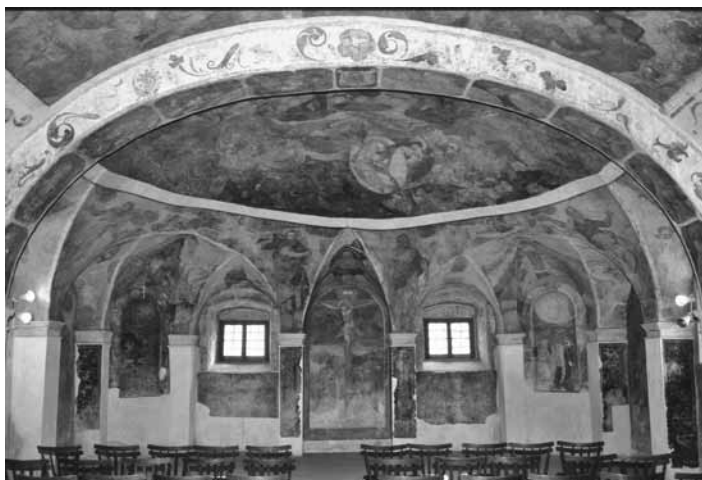
Lichtenwald, Burgkapelle mit Fresken

Führungen in deutscher Sprache: Burg Lichtenwald, Pletriach, Rudolfswerth