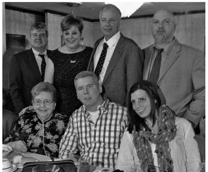
Besucher der Tanzveranstaltung der Gottscheer Vereinigung