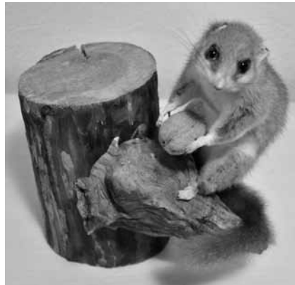
Präparierter Bilch aus dem Museum der Gottscheer Gedenkstätte

insbesondere die öligen Kernfrüchte, wie Bucheckern, Eicheln, Wal- und Haselnüsse. Im Frühling, wenn diese leckere Nahrung noch fehlt, zehrt er vorwiegend vom eigenen Fett. Er begnügt sich auch mit den schwellenden Knospen der Laubbäume und der Sträucher. Auch die Fröhlpilze, wie Morcheln, Eierschwämme und Bärentatzen nimmt er gerne auf. In der Periode der knappen Nahrung, in welche auch seine Ranzzeit fällt, magert der Bilch stark ab, wird ungenießbar und kommt dadurch in seine natürliche Schonzeit. Sind später die Nahrungsverhältnisse geordnet, frisst er nachtsüber, was er fressen kann und wird nach der Ranz- und Säugezeit wieder dick und fett.