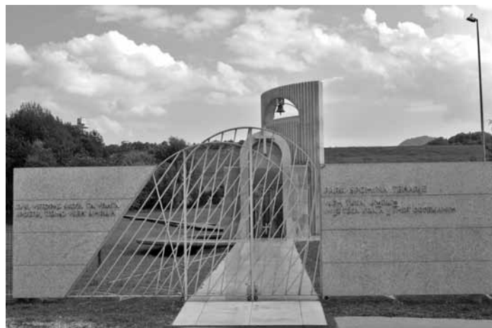
Eingang zur Gedenkstätte in Tüchern

(Podpreska) – Suchen (Draga) – Mittergras (Srednja vas) – Obergras (Trava) – zurück über Soderschitz bis Nova Štifa (denkmalgeschützte Wallfahrtskirche Kirche Maria Neustift aus 1641, Kulturerbe) – Reifnitz (Ribnica) – Laibach (Ljubljana) – Trojane Pass – (Cilli) – Tüchern (Teharje, Gedenkstätte) – Marburg – Wildon – Graz – Kapfenberg (Ankunft ca. 19.00 Uhr)