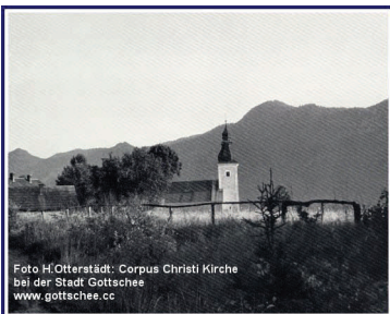
Foto H. Otterstätt: Corpus Christi Kirche bei der Stadt Gottschee www.gottschee.cc